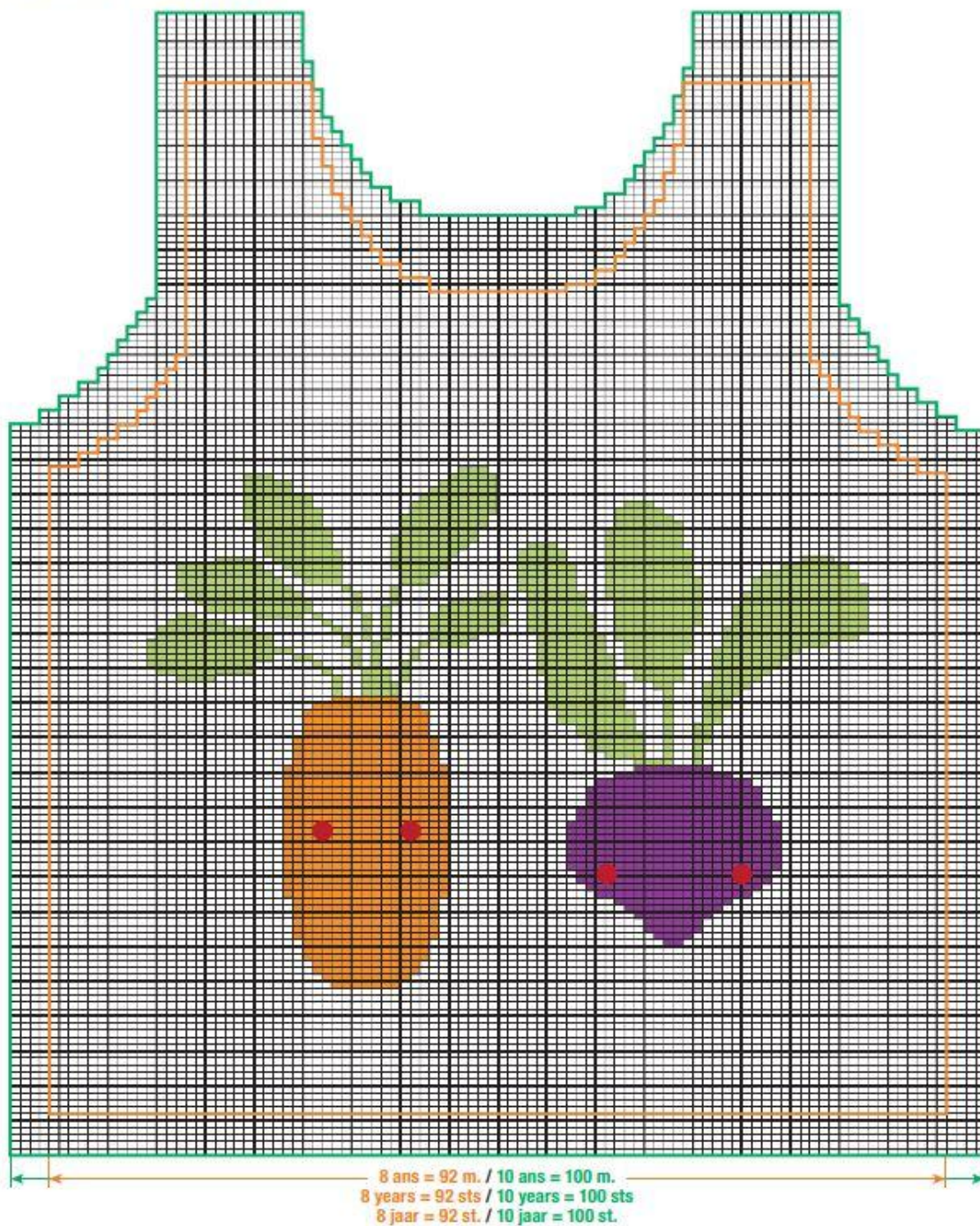
Схема интарсии, размеры 8 и 10 лет (92 и 100 петель)

JACQUARD - Tailles 8 ans et 10 ans INTARSIA - Sizes 8 years and 10 years JACQUARD - Maten 8 jaar en 10 jaar