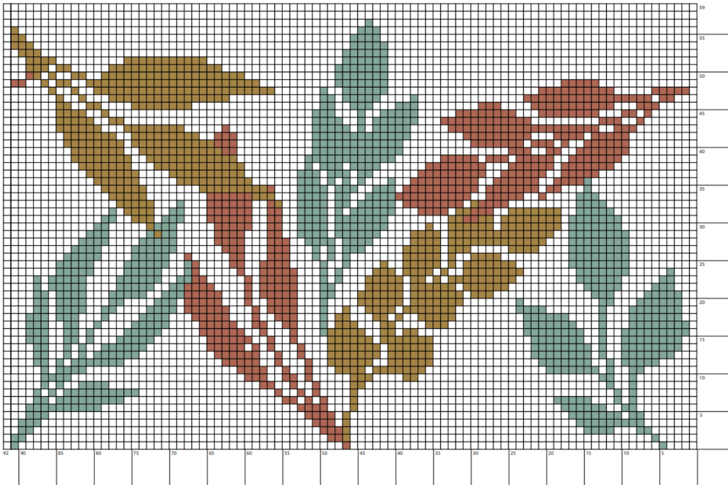
Схема 3 Узор листья